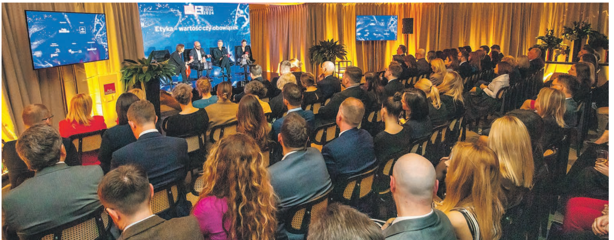
► ETYCZNA ŚMIETANKA: W gali wieńczącej 11. edycję Etycznej Firmy wzięło udział ponad 130 przedstawicieli nagrodzonych firm oraz partnerów konkursu.

Czy etyka i biznes mogą iść w parze? Konkurs Etyczna firma wyłonił firmy, które wyznaczają standardy odpowiedzialnego biznesu